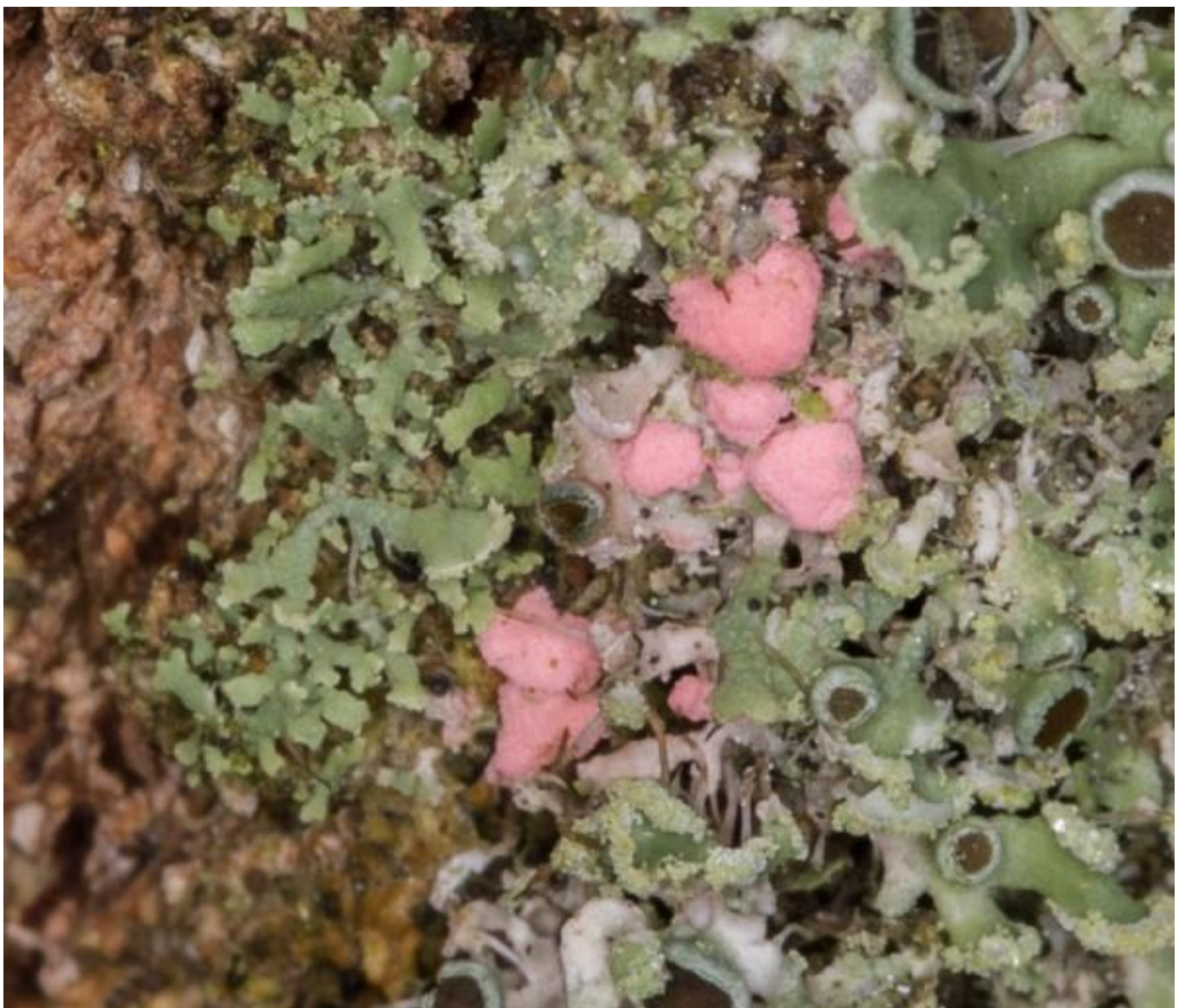
maar de Illosporopsis christiansenii mag natuurlijk niet ontbreken